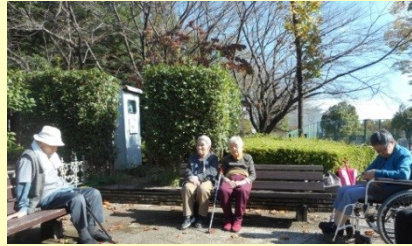
平塚公園に紅葉散策に行ってきました！