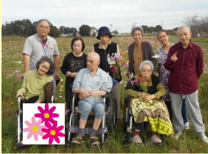
コスモスをバックに記念写真！！

今月は小規模のコスモス見学とGH1Fの紅葉散策の様子を紹介します。GH2Fは今月に紅葉狩りに行く予定です。